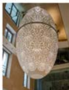
Banque Neillan OBC - Paris

Architecture - Architecture intérieure - Scénographie - Design