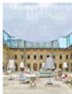
Les Franciscaines - Douville

« La beauté, c'est la qualité de la rencontre »