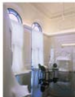
Jean-Paul Gaultier - Paris