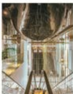
Hôtel JW Marriott - Cannes