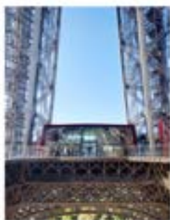
1er étage de la Tour Eiffel - Paris

Architecte, co-fondateur de l'Agence Moatti-Rivière