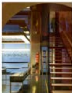
Yves Saint Laurent - Paris

« La beauté, c'est la qualité de la rencontre »