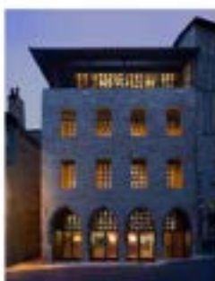
Musée Champollion - Figaro