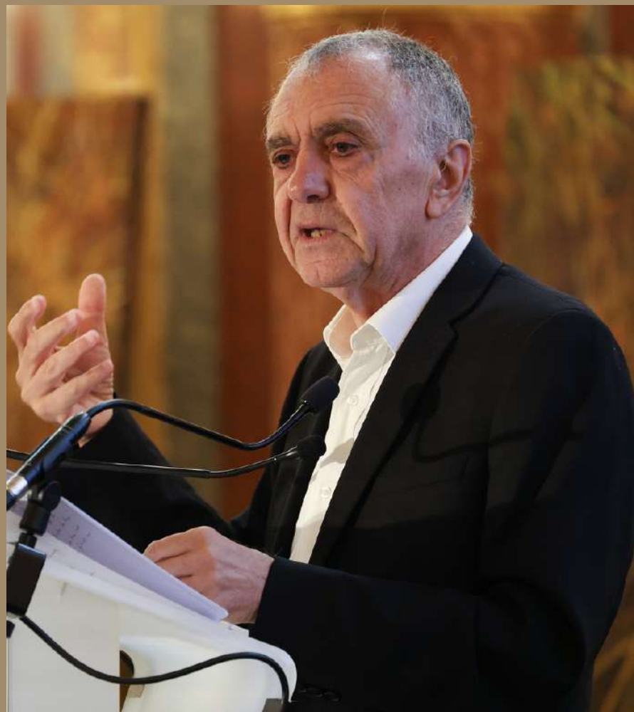
Gilles Lipovetsky, Philosophe