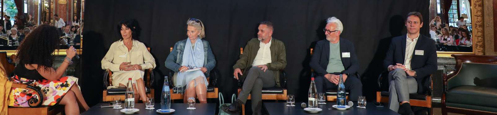
Table ronde introductive de la Cérémonie des Talents : Les Tendances de la Création